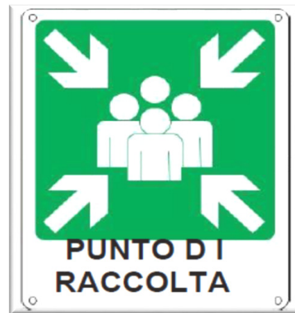
PUNTO DI RACCOLTA

LUOGO SICURO dove riunirsi all'esterno dell'edificio