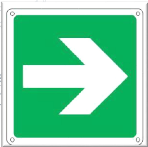
VIE DI FUGA

Indicano il percorso da seguire per raggiungere l'USCITA