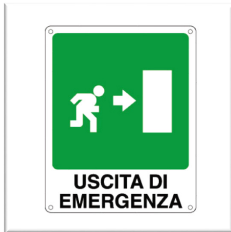
USCITA DI EMERGENZA

Indicano il percorso da seguire per raggiungere l'USCITA